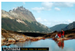
Laguna Esmeralda, una delle destinazioni degli escursionisti locali

Pomeriggio, transfert all'aeroporto e volo per Santiago e quindi verso l'Europa.