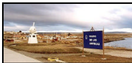
Viale delle Americhe, Porvenir

Al mattino continueremo il cammino per Rio Grande passando per il sud dell'isola. Nei pressi di Onaisin, breve sosta per visitare il cimitero inglese e a Camerón, vecchia estancia e sede del comune di Timaukel. Traverseremo Pampa Guanaco dove la vegetazione arborea si sostituisce alla steppa. Forte presenza di guanaco e le montagne della Cordigliera diventano parte integrante del