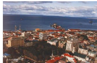
Vue du centre de Punta Arenas et de l'étroit de Magellan

Traversata dello stretto di Magellano in Ferry Boat (2 h et 1/2) fino a Porvenir, piccolo centro (4000 ab.) di fronte a Punta Arenas. Porvenir deve la sua esistenza alla scoperta di miniere d'oro nelle vicine montagne della Sierra Boquerón e la maggior parte dei suoi abitanti sono d'origine croata. Pranzo.