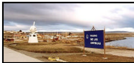
Avenida de las Américas, Porvenir

A la tarde, excursión al borde del océano, Cabo San Pablo. Alojamiento en la Estancia Rolito (*) y en el Paredor Yawen que se halla en las primeras estribaciones de la Cordillera. Cena.