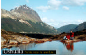
Lago Esmeralda, uno de los destinos favoritos de los trekkers locales

Por la mañana, subida en jeep al Cerro Shenolah (últimos 50 metros caminando) de donde podrán admirar un paisaje de belleza extraordinaria con vista de los tres lagos de Chelpmuth, Yehuin y Fagnano. Es posible avistar cóndores. Almuerzo. A la tarde, navegación del lago Yehuin (según las condiciones climáticas). Cena.