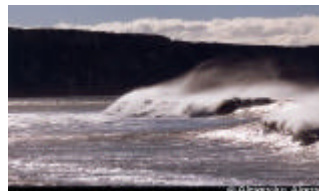
Cabo San Pablo (Tierra del Fuego)

bre todo la explotación del petróleo a partir de los años 50 permitió una diversificación económica de la región. El desarrollo turístico de Ushuaia ha logrado hacer conocer la isla en el resto del mundo pero a pesar de eso hay todavía una presencia turística limitada y por supuesto la Naturaleza sigue siendo la sola y indiscutible soberana. Una razón mas para descubrirla