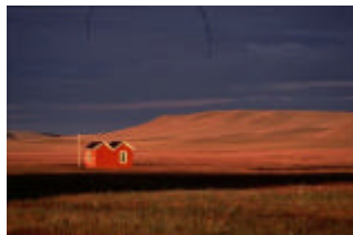
Estancia Flamenco (Tierra del Fuego)

Los Argentinos suelen llamar a esta tierra extrema: "donde empieza el mundo" y tienen razón si consideramos el Polo Sur como la parte superior del planeta. Dotada de una belleza virgen y salvaje, Tierra del Fuego es una isla con vastos espacios de pasto (estepa patagónica) poblada sobre todo por ovejas y guanacos y donde las estancias son, sin duda, el solo testimonio de la presencia humana. Las suaves colinas cubiertas por estepas, dejan percibir un cierto rasgo de la presencia mas al sur de la isla, de inmensos bosques y montañas majestuosas de la Cordillera Andina, con los picos nevados la mayor parte del año. La colonización europea